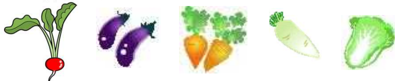
赤カブ・茄子・にんじん・大根・白菜

トマト・胡瓜は秋の野菜達に役を譲って 舞台から消えて行きました。茄子は、思い切った強剪定を行い残した全ての節からは新芽が出ており、菜園の舞台に残っております。野菜のラインナップを新たにし、皆様に食べて頂ければ、嬉しいです。